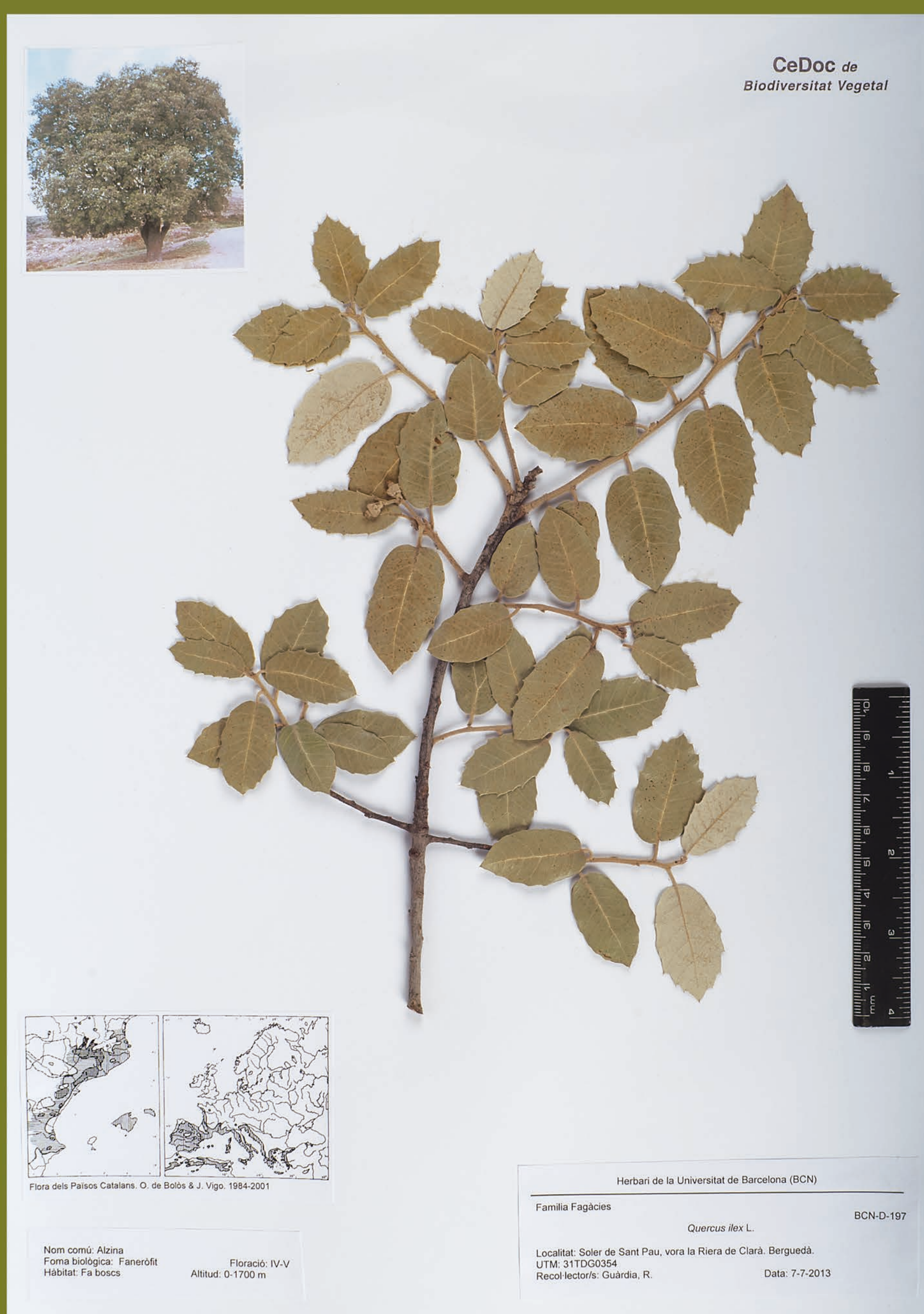
Etiqueta d'herbari amb el nom científic i les dades sobre on i quan es va recollir la planta