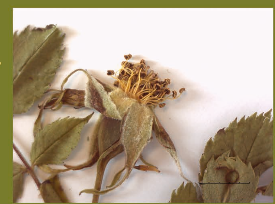
Detall de la flor, amb ovari ífer i nombrosos estams