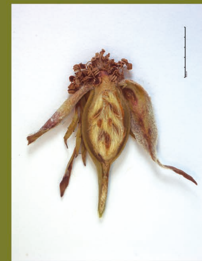
Cinèdron o polifruit del roser amb nombroses núcules a l'interior